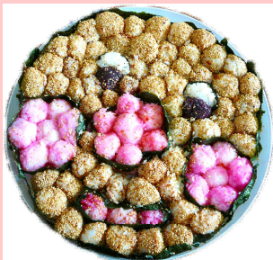
かがやけ!!アンパンマン