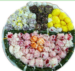
佐世保と言えは船