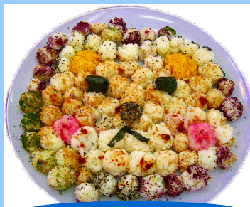
B e a r