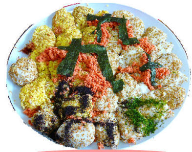
九十九島せんべい