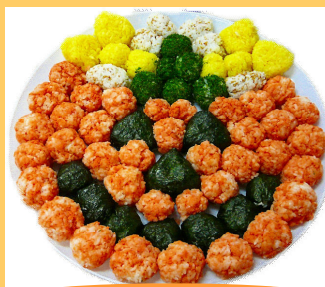
オータム・ハロウィン