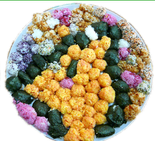
パールシーのイルカ

毎年、おにぎリンピック本番を前に、リハーサルを兼ねて校内おにぎリンピックを開催しています。今年も10月21日(木)、生徒が実際の競技者となって“びったり部門”と“デザイン部門”に挑戦しました。“びったり”では、何と誤差0のチームが見事優勝。“デザイン”は高校生ならではの感性で、楽しい作品が完成しました。優勝は「チューリーちゃん」をつかったC組チームでした。