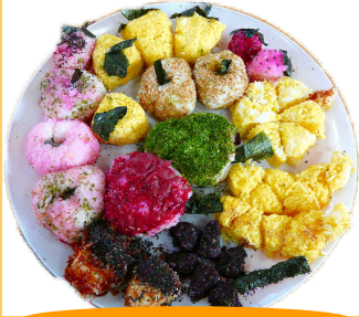
おいしい果実たち