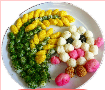
おにぎりの原点とマイちゃん