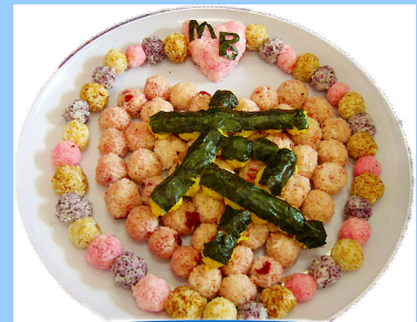
M B 友