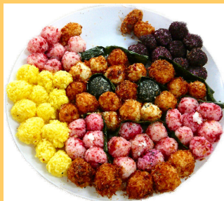
アンパンマンと秋の食