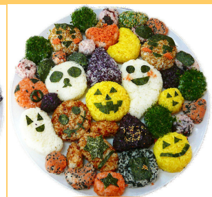
秋はにぎりアロウのパーティー