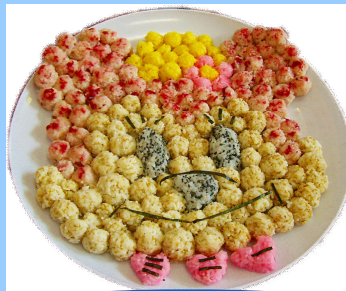
ニ - c h a n