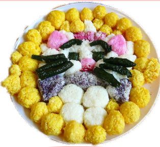
愛しのマリちゃん