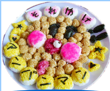
日焼けきみのおれゆけ! アンパンマン