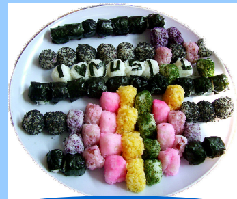
NO MUSIC, NO LIFE