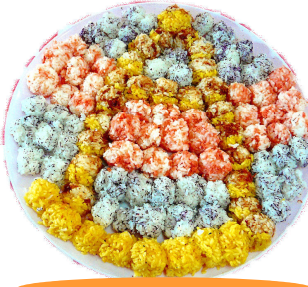
A K I