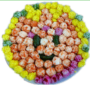
チューリーちゃん